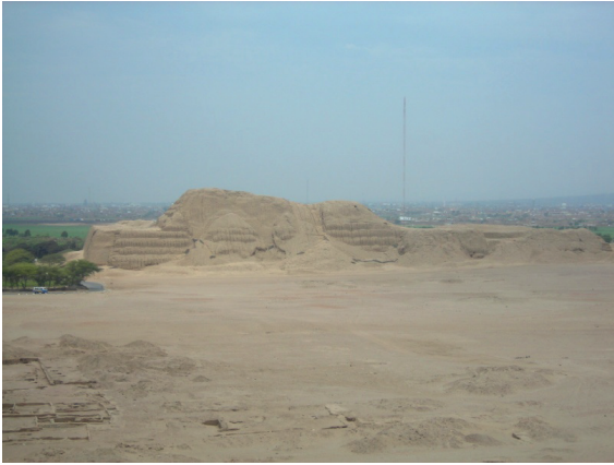
Figura 5: Huaca de El Sol, Valle de Moche Figure 5: Huaca de El Sol, Moche Valley

Por tanto, la superación de la relación dialéctica de tensión (seres sociales ↔ otras entidades primarias y secundarias) que da surgimiento a la base social de las comunidades del valle de Moche es la que produce la extensión de la producción de alimentos a nivel de agricultura extensiva (Uceda y Castillo, 2008). Esta superación y cambio histórico produce la ampliación de la concentración de seres sociales (producción de seres sociales) y artefactos en poblados como las primeras ocupaciones de la Huaca del Sol y de la Luna (Topic, 1977: 51-128, 138; Makowski, 2009: 36; Uceda et al., 2009: 110), un patrón similar a lo que ocurría contemporáneamente en los sitios de Mocollope y El Brujo en el valle de Chicama (Attarian, 2009; Mujica, 2007: 81; Franco y Gálvez, 2009) (Figura 6). Estas nuevas comunidades pudieron haber solventado la relación de tensión mediante la generación de una forma de vida comunitaria. Sin embargo, sus relaciones de tensión y sus decisiones políticas condujeron a la diferenciación socioeconómica. La primera de ellas fue la que dividió a las comunidades entre seres sociales productores principalmente de artefactos y seres sociales principalmente controladores y consumidores de artefactos.