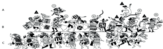
Figura 9: Combate entre guerreros moches y recuays.

Otra formación social que también vale la pena tomar en cuenta aquí es la Recuay , la cual fue una contraparte de los Moche y ocupaban un espacio ecológico que les era extraño. Recuay ha sido definida recientemente como una “serie de entidades políticas de jefaturas independientes que estaban en emergencia dentro de un contexto de comunidades dispersas relativamente igualitarias” (Lau, 2011: 14). Al parecer, entre estas “ jefaturas ” no existió una integración política aunque si compartieron un estilo cerámico y litoescultórico característico (artefactos) y una forma de asentamiento en los valles interandinos del actual Departamento de Ancash. De hecho, el asentamiento humano en esta región serrana supuso una relación dialéctica con respecto a la producción e intercambio que tuvo varios episodios de convivencia, colaboración y hasta de asimilación de ciertos elementos religiosos (Bruhns, 1976; Proulx, 1982: 89; Mujica, 2007: 126, 146; Shimada, 2010). Sin embargo, también se dieron episodios tensos en que el Estado Moche tuvo que establecer el control de su territorio y recursos por medio de la fuerza (Lau, 2004: 162, 2014: 322) (Figura 9).