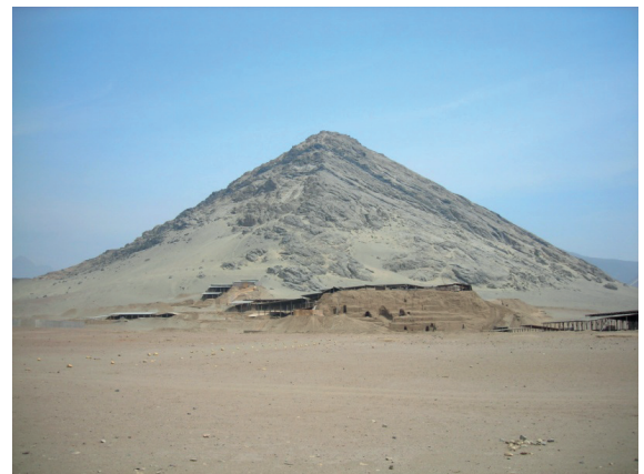
Figura 4: Cerro Blanco y la Huaca de la Luna.

entidades primarias (tierra y agua) y secundarias (plantas y animales)) estaba en pleno desarrollo habiendo dominado, como lo hicieron sus antecesores, la producción agrícola y ganadera (domesticación de plantas y animales). Asimismo, en las diferentes comunidades de estos valles ya existía una producción de artefactos a través del uso de objetos inorgánicos como el barro, la arcilla, los minerales, etc.