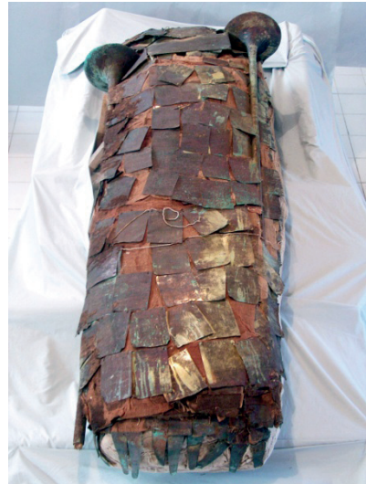
Figura 7: Fardo de la Señora de Cao.

existía una clara relación dialéctica de tensión entre hombres y mujeres.