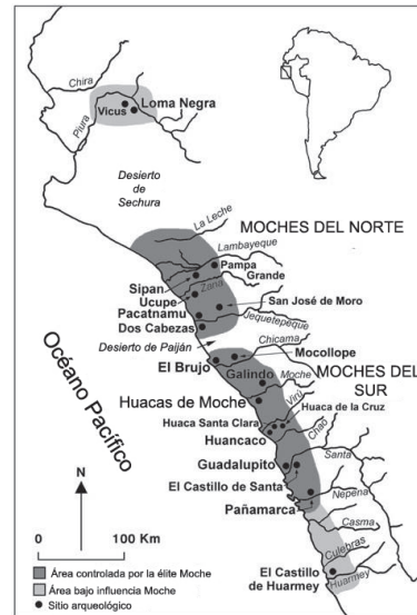
Figura 3: Territorios Moche según Chapdeleine 2010

Así, el surgimiento de lo Moche contaba con un trabajo acumulado por las comunidades precedentes y la producción primaria de alimentos (relación dialéctica entre los seres sociales y otras