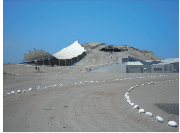
Figura 6: Huaca Cao, Complejo El Brujo, valle de Chicama Figure 6: Huaca Cao, El Brujo Complex, Chicama valley

Así, las primeras concentraciones permanentes de sujetos en torno a la religión 7 formaron la base para la generación de grupos especializados y alejados de la reproducción de entidades potenciadoras primarias y la producción de artefactos. Este grupo de especialistas a tiempo