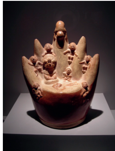
Figura 8: Vasija de Huancaco, valle de Virú. Museo Larco.

Asimismo, en su desarrollo histórico material e ideológico (sobre todo de la apropiación de artefactos ), las elites moche también generaron sus propias facciones (relaciones dialécticas de tensión entre grupos diferenciados de seres sociales dominantes) lo cual llevó a una tensión adentro del grupo social dominante. Por otra parte, en el transcurso de su historia, el ritual y la ideología religiosa tuvieron que ser recreados para seguir