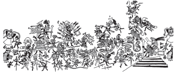
Figura 2: desarrollo del tema de la Revuelta de los Objetos del Vaso de Munich según Kutscher 1983. Tomado de Quilter 1990.

La sociedad conocida como Moche o Mochica es una de las mejores estudiadas en la